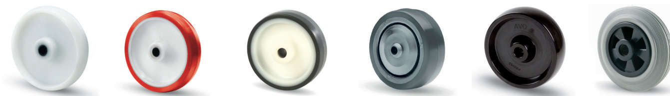
116 Poliammide 6 wheel

Housings in stainless steel AISI 316 can be assembled with the following wheels: I supporti INOX AISI 316 possono essere assemblati con le seguenti ruote: